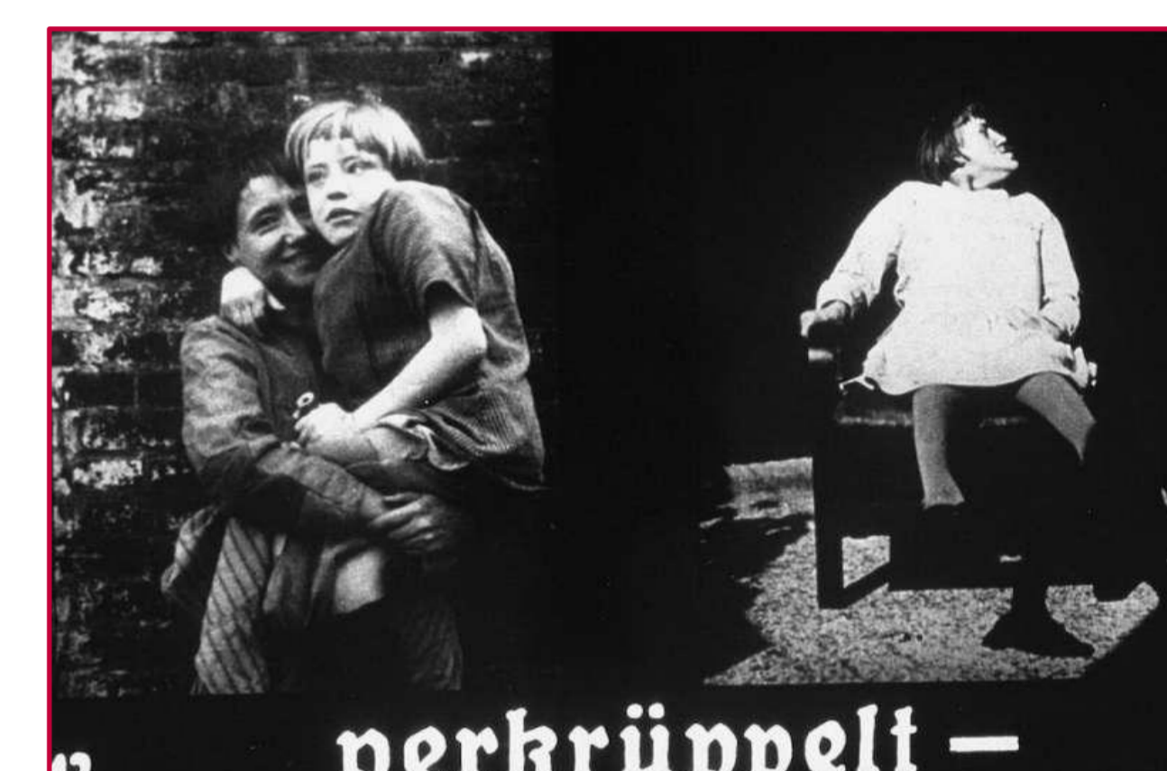
« Condition visible » : affiche de propagande nazie montrant deux enfants avec des handicaps physiques.