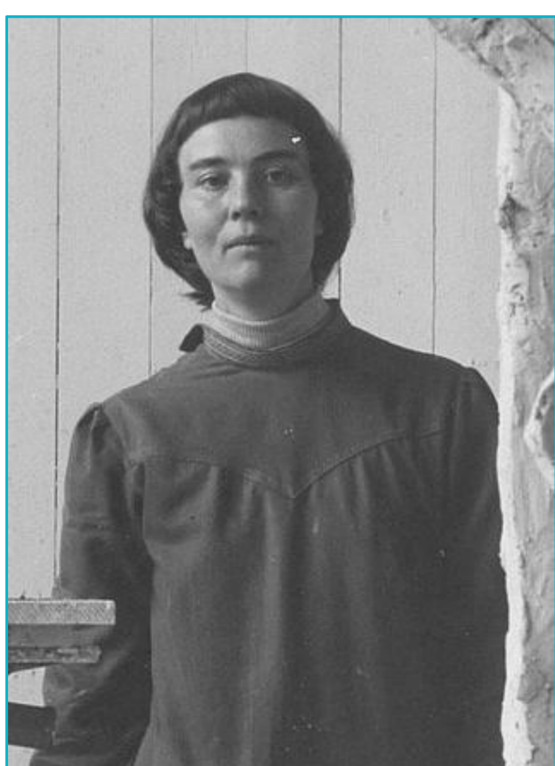
« Condition invisible » : Dorothea Buck, stérilisée de force à l'âge de 19 ans à cause de son diagnostic de schizophrénie.

Objectif : dans le cadre d'un stage de recherche de Master 1 en sciences psychologiques, réaliser une revue de littérature sur la stérilisation forcée en Allemagne nazie, en analysant les troubles ciblés à l'époque, en les comparant aux connaissances actuelles, ainsi que les conséquences psychologiques des victimes et les enjeux cliniques contemporains en collaboration avec l'ASBL Mémoire d'Auschwitz.